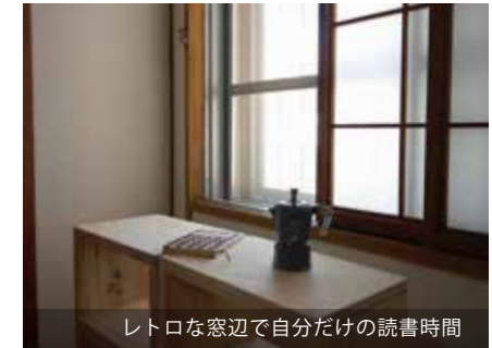
レトロな窓辺で自分だけの読書時間