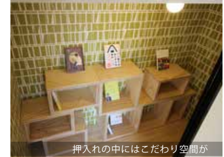
押し入れの中にはこだわり空間が