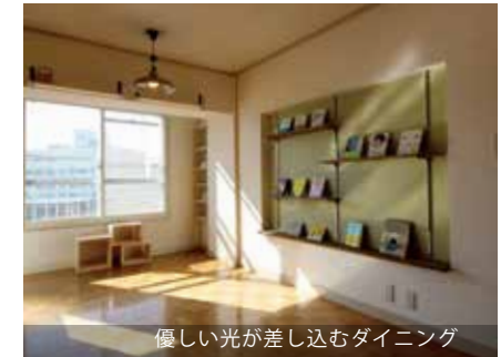
優しい光が差し込むダイニング